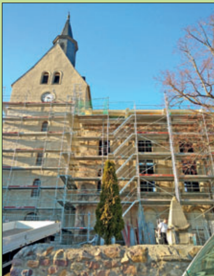
Kirche Mochau, rundherum eingerüstet