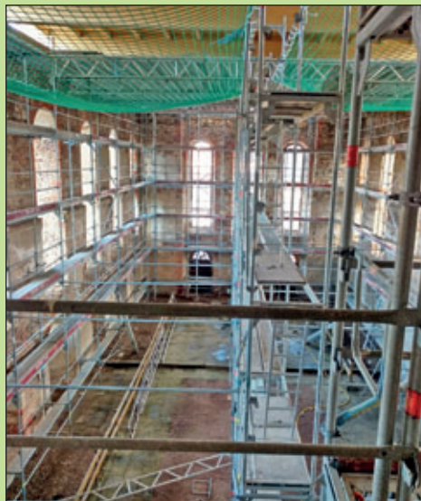
vollständig eingerüsteter Innenraum der Kirche