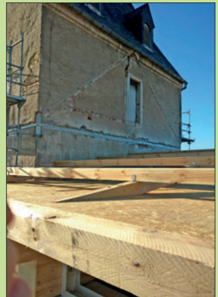
Blick über das verschaltete Dach auf den vorgespannten Stahlgurt

Kirchenvorstand der Kirchgemeinde Beicha-Mochau