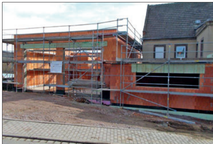
aktueller Ausbaustand des neuen FFW-Gerätehauses Beicha